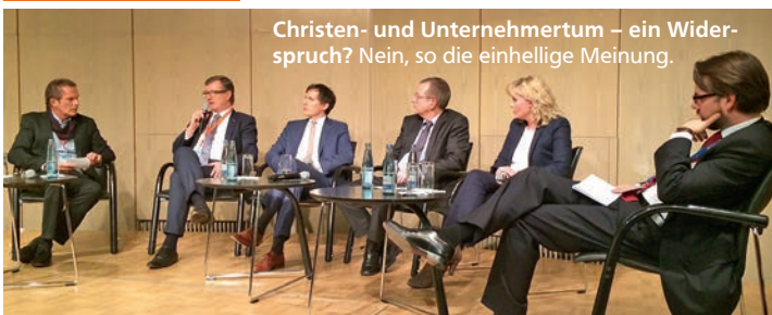
Christen- und Unternehmertum – ein Widerspruch? Nein, so die einhellige Meinung.