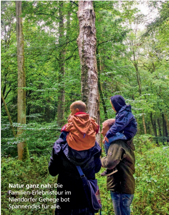
Natur ganz nah: Die Familien-Erlebnistour im Niendorfer Gehege bot Spannendes für alle.

NATUR PUR FÜR DIE GANZE FAMILIE Laub raschelt im Wind, Zweige knacken unter den Füßen, Tiere bewegen sich im Unterholz – ein Ausflug in den Wald ist spannend und lehrreich. Am 31. August 2014 erlangten Kinder und Eltern bei einer Erlebnistour durchs Niendorfer Gehege jede Menge Wald-Wissen. Begleitet von Mitarbeitern der Hamburger Volksbank und mit Unterstützung der Deutschen Waldjugend Landesverband Hamburg e. V. lösten die Kleinen an Stationen interessante Aufgaben. Welche Bäume wachsen im heimischen Forst? Wer wohnt im Waldboden? Welches Tier hat dort seine Spuren hinterlassen? Nach der Rallye konnten sich die Kinder auf dem Spielplatz austoben, sich zu einem tierischen Waldbewohner schminken lassen oder ein eigenes Holzmedaillon gestalten. Weiteres Highlight: Wer Lust auf einen frischen Saft hatte, setzte sich auf ein Fahrrad und „erstrampelte“ Strom für eine elektrische Saftpresse. Ein rundum gelungener Tag, der Groß und Klein begeisterte.