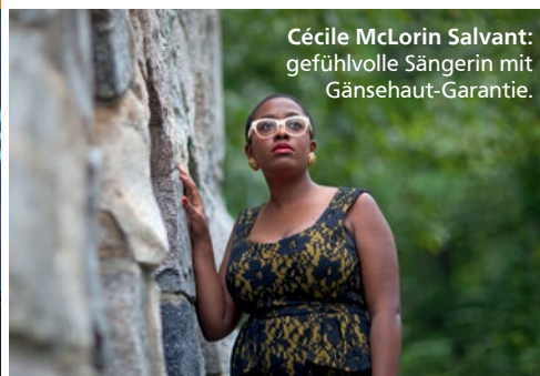
Cécile McLorin Salvant: gefühlvolle Sängerin mit Gänsehaut-Garantie.