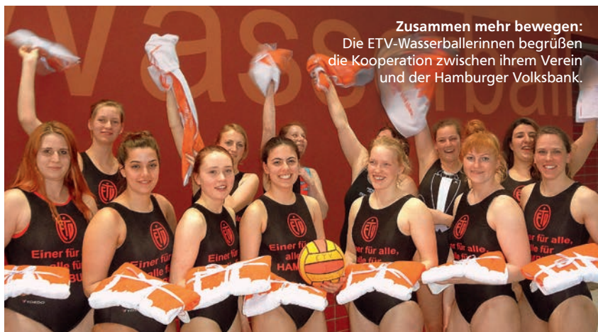
Zusammen mehr bewegen: Die ETV-Wasserballerinnen begrüßen die Kooperation zwischen ihrem Verein und der Hamburger Volksbank.