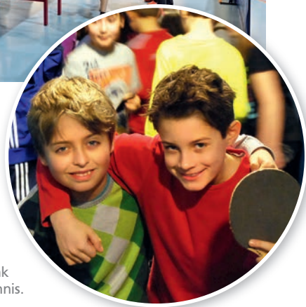
Begeistert: Kinder und Jugendliche hatten in der Hamburger Volksbank Arena viel Spaß beim Tischtennis.