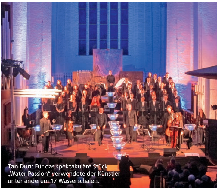
Tan Dun: Für das spektakuläre Stück „Water Passion“ verwendete der Künstler unter anderem 17 Wasserschalen.