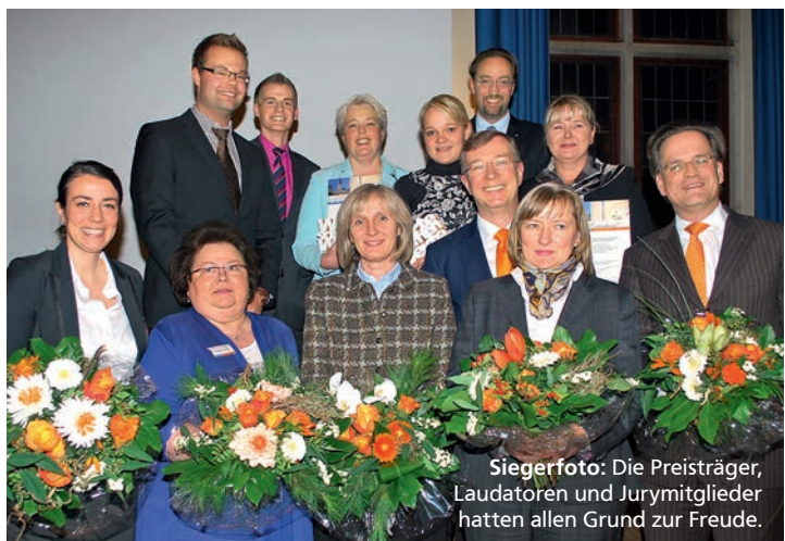
Siegerfoto: Die Preisträger, Laudatoren und Jurymitglieder hatten allen Grund zur Freude.