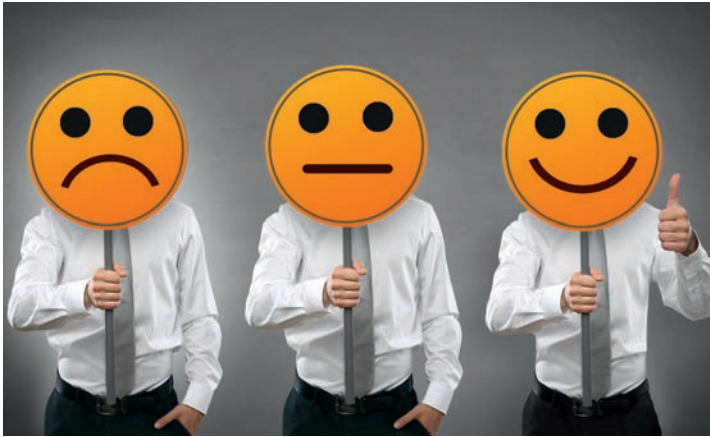
Umfrage: Kunden und Volksbank-Mitarbeiter bewerteten FinTechs.