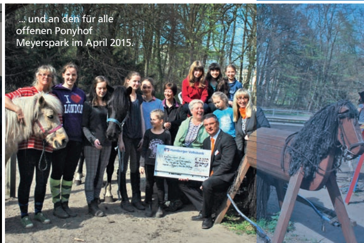
... und an den für alle offenen Ponyhof Meyerspark im April 2015.