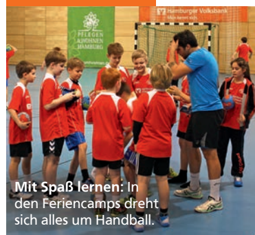
Mit Spaß lernen: In den Feriencamps dreht sich alles um Handball.

Die Jugendarbeit beim HSV-Handball wurde Anfang 2015 zum siebten Mal in Folge von der DKB Handball-Bundesliga mit dem HBL-Jugendzertifikat ausgezeichnet.