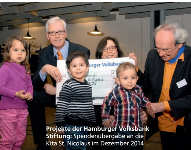
Projekte der Hamburger Volksbank Stiftung: Spendenübergabe an die Kita St. Nicolaus im Dezember 2014 ...

Dem Ponyhof Meyerspark sowie vielen gemeinnützigen und sozialen Einrichtungen in der Stadt, so auch der Kita St. Nicolaus, greift die Hamburger Volksbank Stiftung finanziell unter die Arme. Mit ihrer Stiftung unterstützt die Hamburger Volksbank seit 2011 zudem Menschen, die sich für das Gemeinwohl engagieren möchten. Interessierte können sich auf vielfältige Art einbringen, etwa mit einem finanziellen Beitrag in eines der stiftungseigenen Projekte oder mit einer eigenen Stiftung, die von der Hamburger Volksbank Stiftung begleitet und treuhänderisch verwaltet wird. So können Hamburger das kulturelle und soziale Gesicht ihrer Stadt aktiv mitgestalten. ■