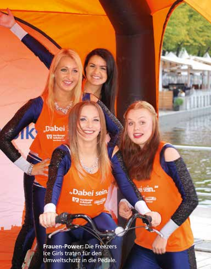
Frauen-Power: Die Freezers Ice Girls traten für den Umweltschutz in die Pedale.