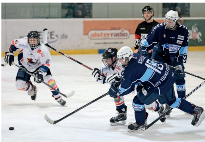
Mit den Besten messen: Die Deutsche Nachwuchsliga soll jungen Spielern professionelle Bedingungen und den Sprung in den Herrenbereich ermöglichen.