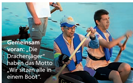
Gemeinsam voran: „Die Drachenjäger“ haben das Motto „Wir sitzen alle in einem Boot“.

Mit dem Preis werden jährlich ehrenamtliche Vereine auf kommunaler, Landes- sowie Bundesebene mit Sternen in Bronze, Silber und Gold ausgezeichnet.