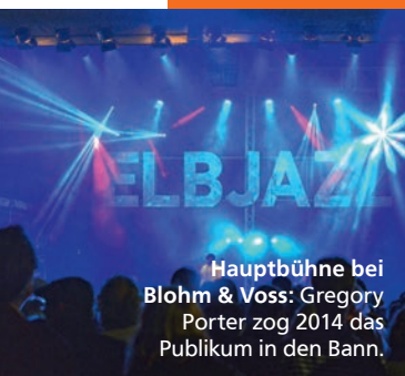
Hauptbühne bei Blohm & Voss: Gregory Porter zog 2014 das Publikum in den Bann.

Alle Interview-Videos von den ELBJAZZ Festivals unter: www.youtube.com/kulturport