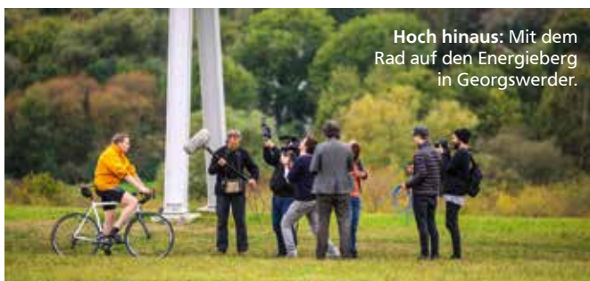
Hoch hinaus: Mit dem Rad auf den Energieberg in Georgswerder.